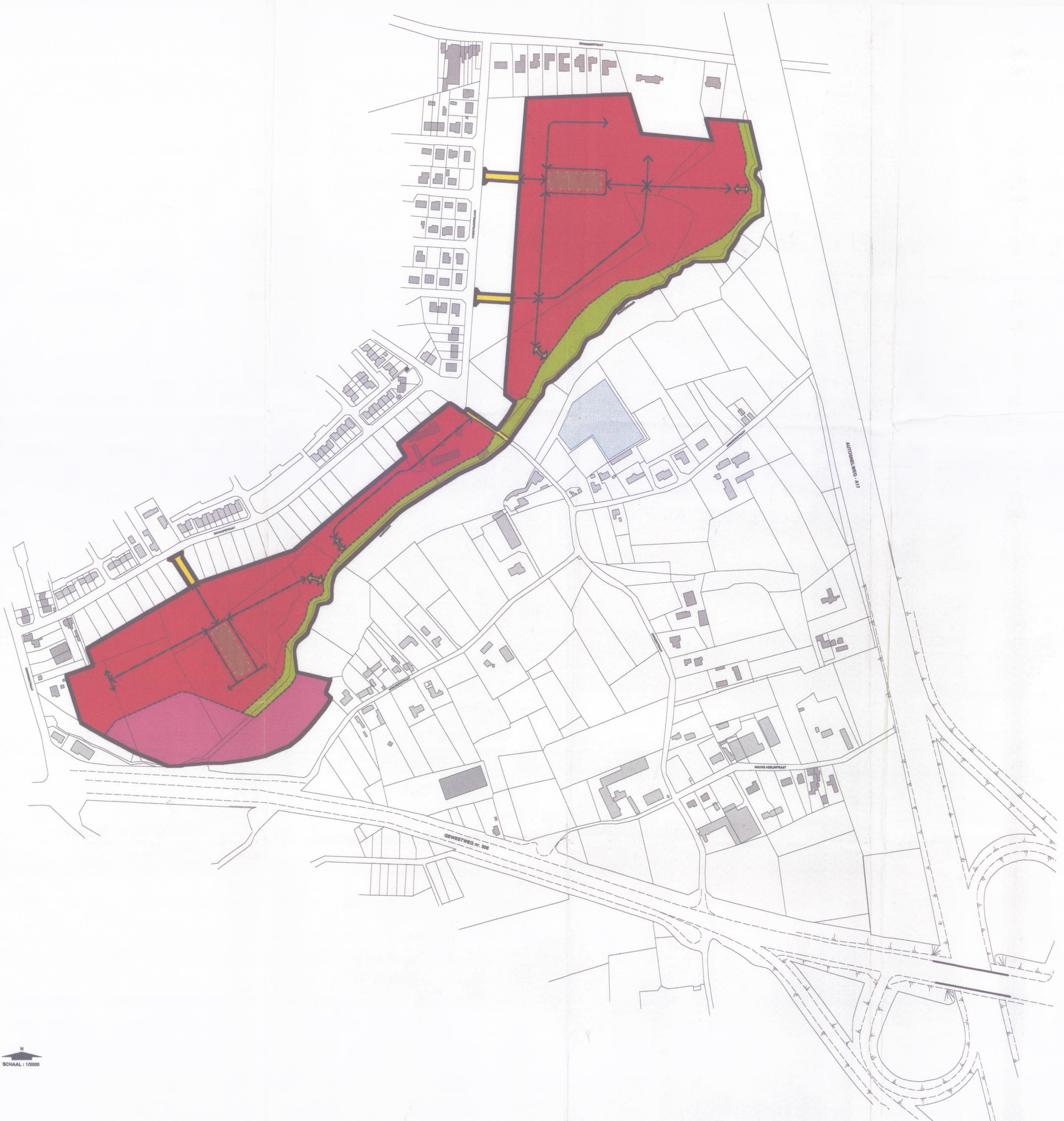
SCHAAAL : 1/2000

gezien en voorlopig aangenomen door de gemeenteraad in vergadering van 14/04/02