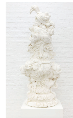
'Knickerboxer Glory' 2019 (installatie)