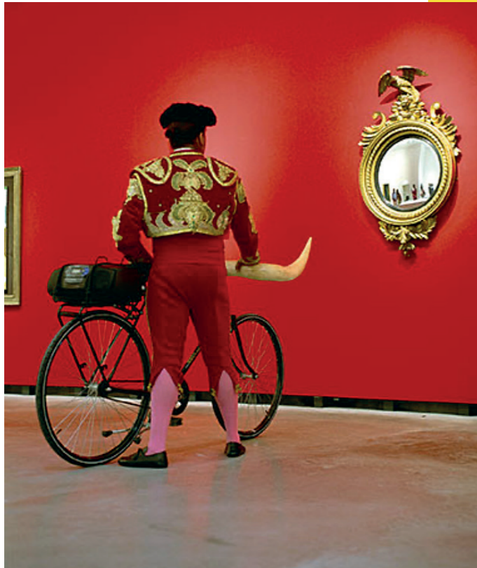
'Torero Torpédo, col d'Aubisque'- 2008 (installatie)