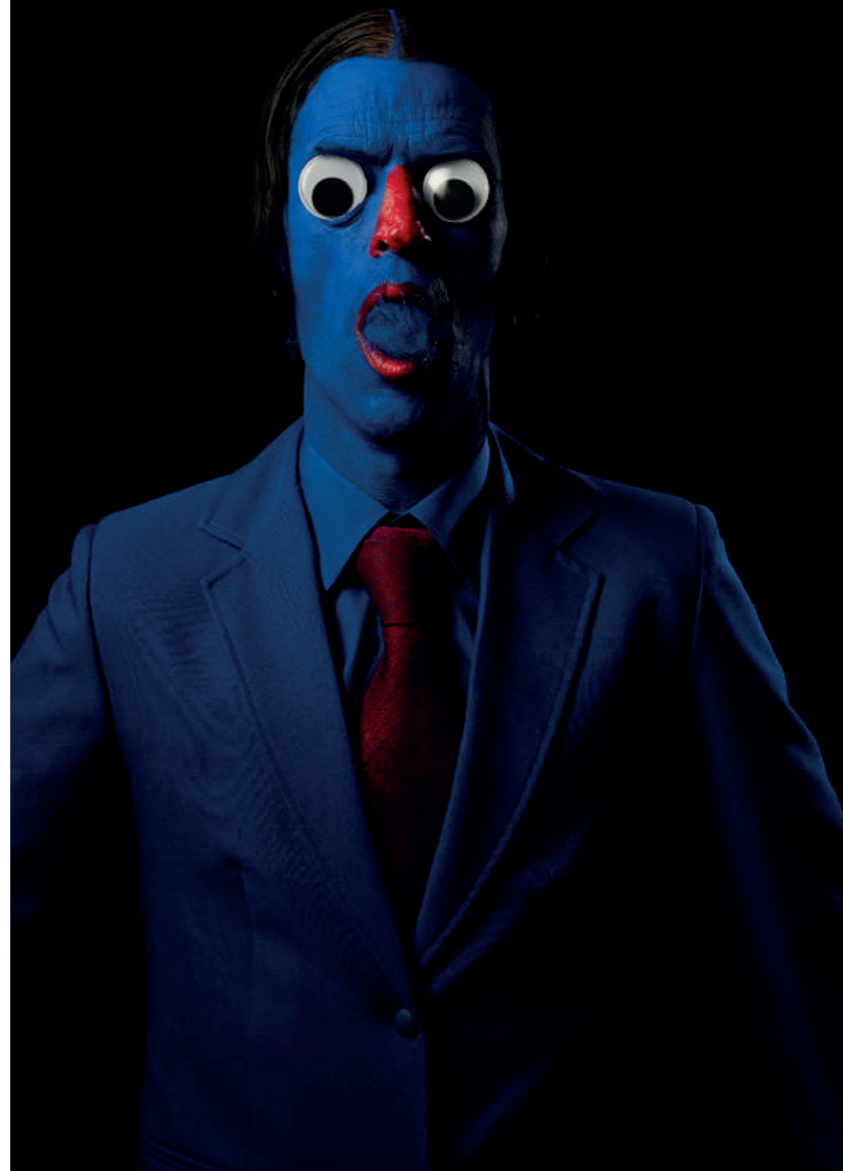
My Own Ego, Nobody Is Perfect (In Reverse) - 2011 en Ugly Sesame Street Man - 2017 (installatie en video)