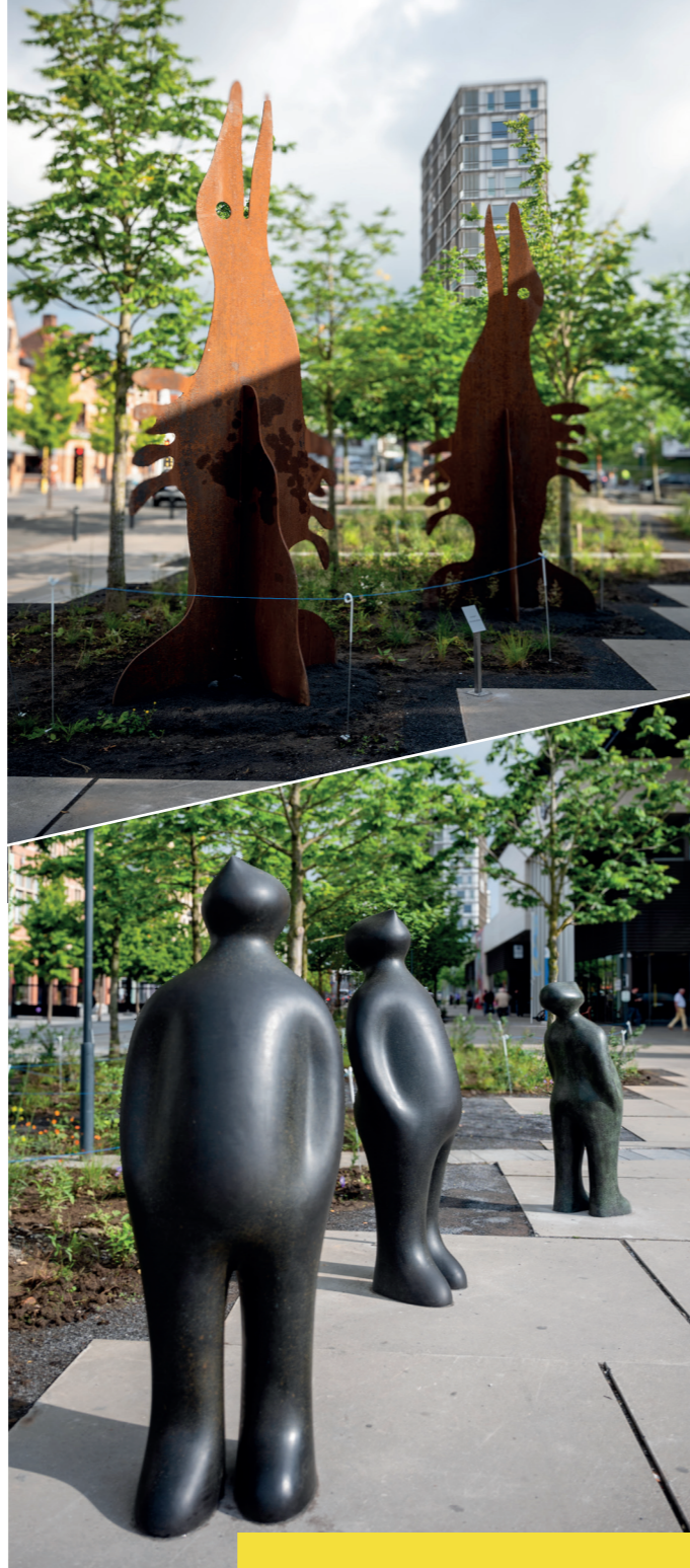
The early Birds en The Visitor