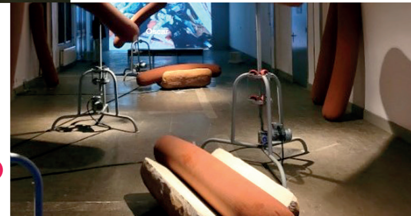
'The Urge' (installatie) Sint-Alfonsusstraat 4b1