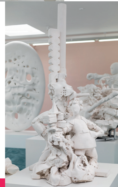
'Les Bois de Construction Saint-Bonnet-Tonçais' 2017 (installatie)