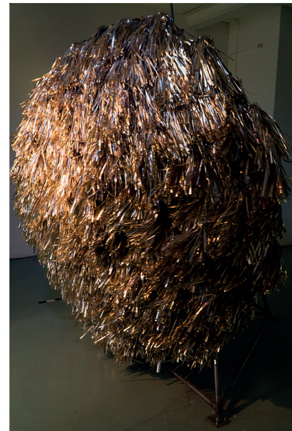
'Halo' (installatie) Citroenstraat 7 (dakterras Couture Robel)