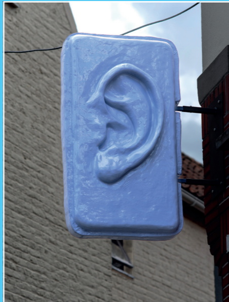
'Well matched' 2023 (installatie)