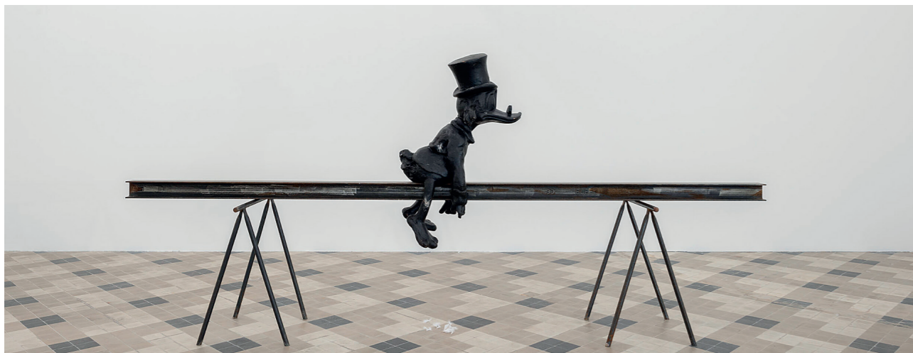
'(Casse-toi alors) Pauvre canard!' (installatie) @Sven 't Jolle