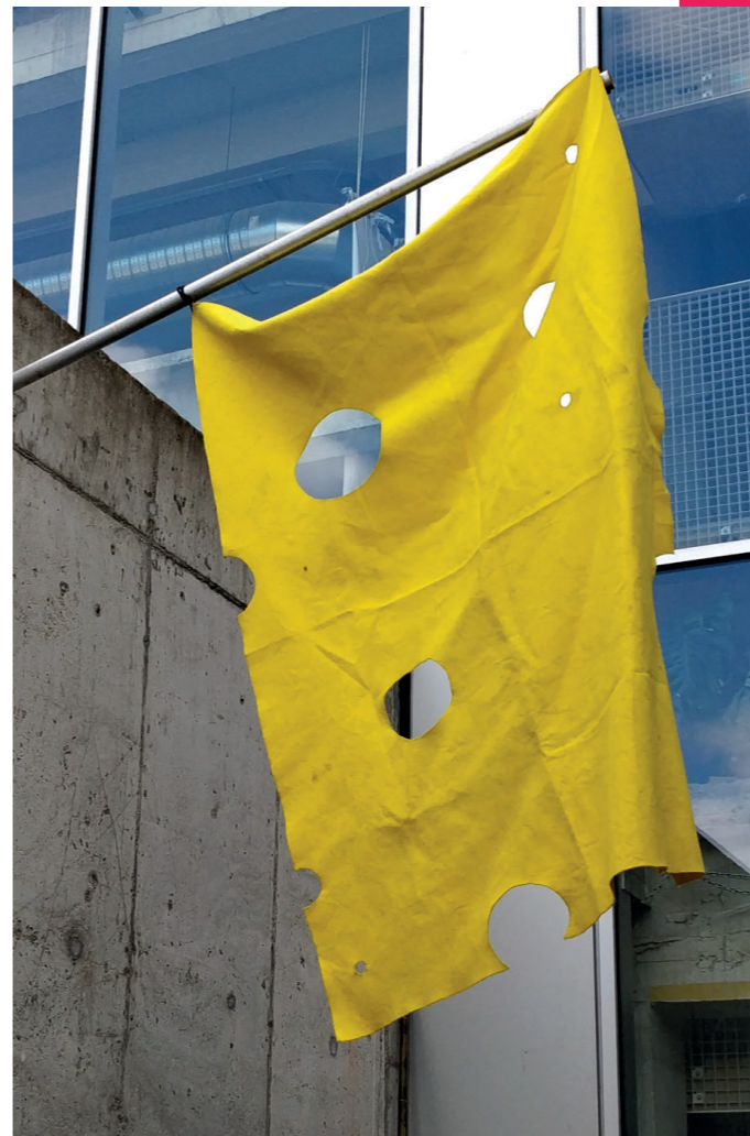
'Fighting for world cheese' 2022 (installatie)