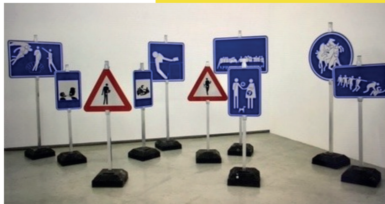
'Let's get classical' 2009-2018 en 2024 (installatie)