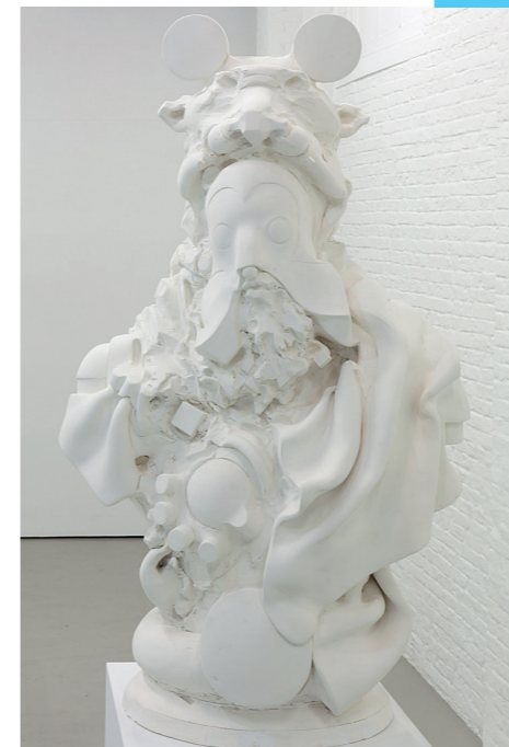
'Def Ted' - 2014 (installatie)